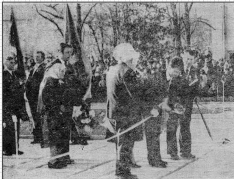
Момент открытия памятника

Главной достопримечательностью села является памятник - мемориал землякам, павшим в годы гражданской и Великой Отечественной войн. Мемориал располагается в самом центре села, в парке. Памятник посвящен участникам Отечественной Войны и мирным жителям, погибшим в оккупации. 437 спицевцев поименно перечислены на мемориале, 97 из них пали от рук белогвардейцев, остальные – от рук фашистов. В центре памятника – бюст спицевца, героя Советского Союза гвардии рядового В.Е. Никитина, погибшего в боях с захватчиками.