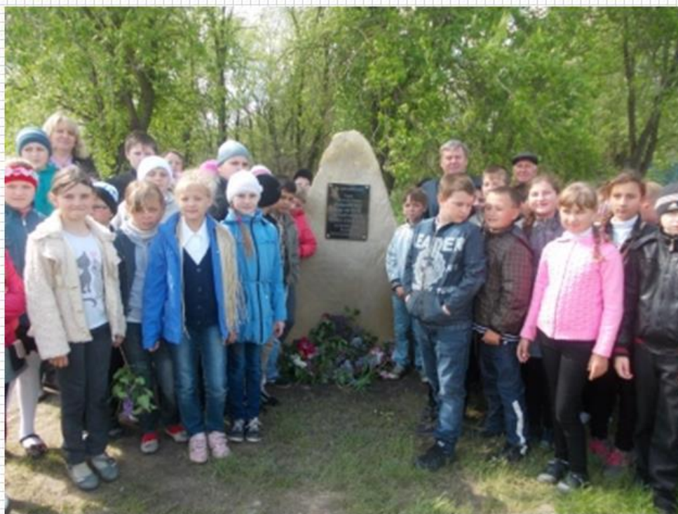
Памятный камень в честь Героя на улице В. Никитина