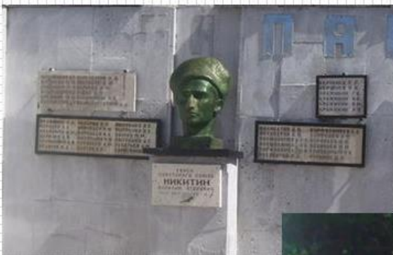
Бюст В.Е. Никитина