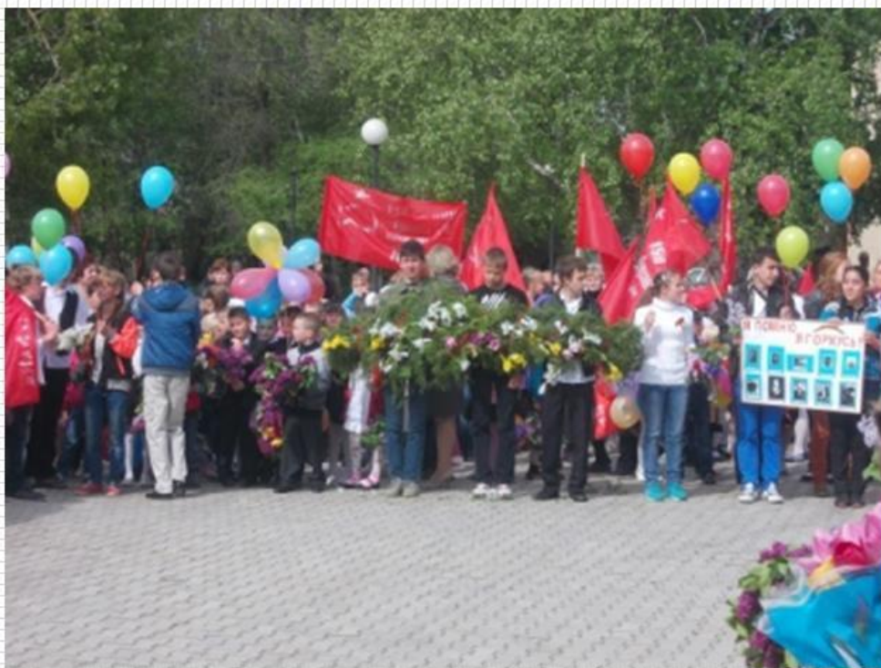
Момент торжественного мероприятия