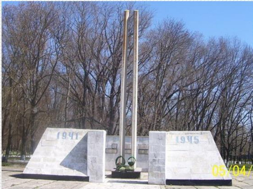
с. Спицевка. Памятник-мемориал участникам гражданской и Великой Отечественной войн.